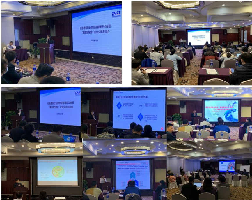
“家庭友好型”企业交流座谈会暨信息通信行业供应链管理研讨会