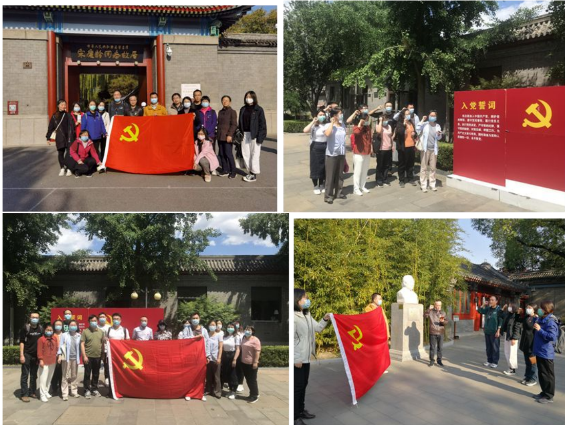
多种形式的主题教育活动

做好疫情防控的前提下继续开展多次党员活动。 组织党员参观了北京鲁迅博物馆、宋庆龄故居等，继续以党员过集体政治生日、重温入党誓词等形式提升党员的责任感和使命感，用伟人的精神不断增强党员的爱国情怀。